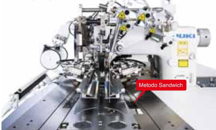
*TLa figura mostra la APW-896N.

Questo dispositivo di trasporto è particolarmente adatto per il movimento di materiali particolarmente difficili da trasportare, grazie al movimento combinato pinze-piani.