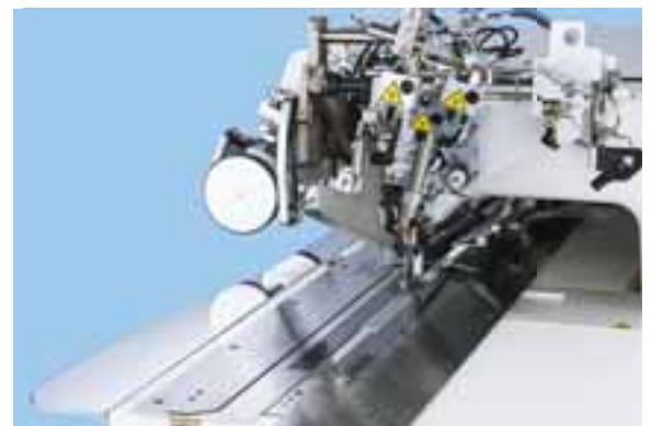
* The picture shows the APW-896N.

* La SA-127 non viene richiesta nel caso si dispone già di una aspirazione centralizzata, con la possibilità di essere collegata alla macchina.