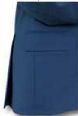
Cucitura profilo con pattina