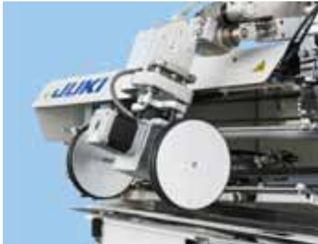
SP-47N: Impilatore a rulli

Sono disponibili due tipi di impilatori, a barre (SP-46N) e a rulli (SP-47N). Con questi nuovi tipi di impilatori è possibile impilare capi di abbigliamento con tasche posizionate a 250 mm. dal bordo della giacca. Un sensore per impilatore provvisto come standard, previene errori dovuti alla mancata impilatura dei capi.