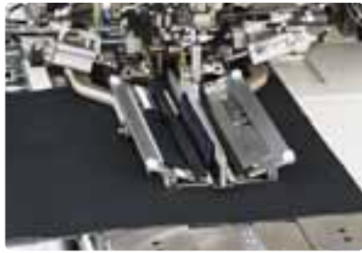
*La figura mostra la APW-896N.

La macchina esegue cuciture di profili paralleli (con pattine) su abiti, giacche e pantaloni. Cuciture di profilo doppio/singolo può essere cambiato facilmente con un semplice tocco sul pannello operativo. Campo di regolazione della lunghezza della cucitura (min. 18 mm. a un max. 220mm.)