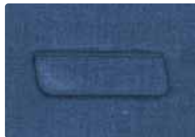
Esecuzione di tasche inclinate (applicazione di pattine inclinate)