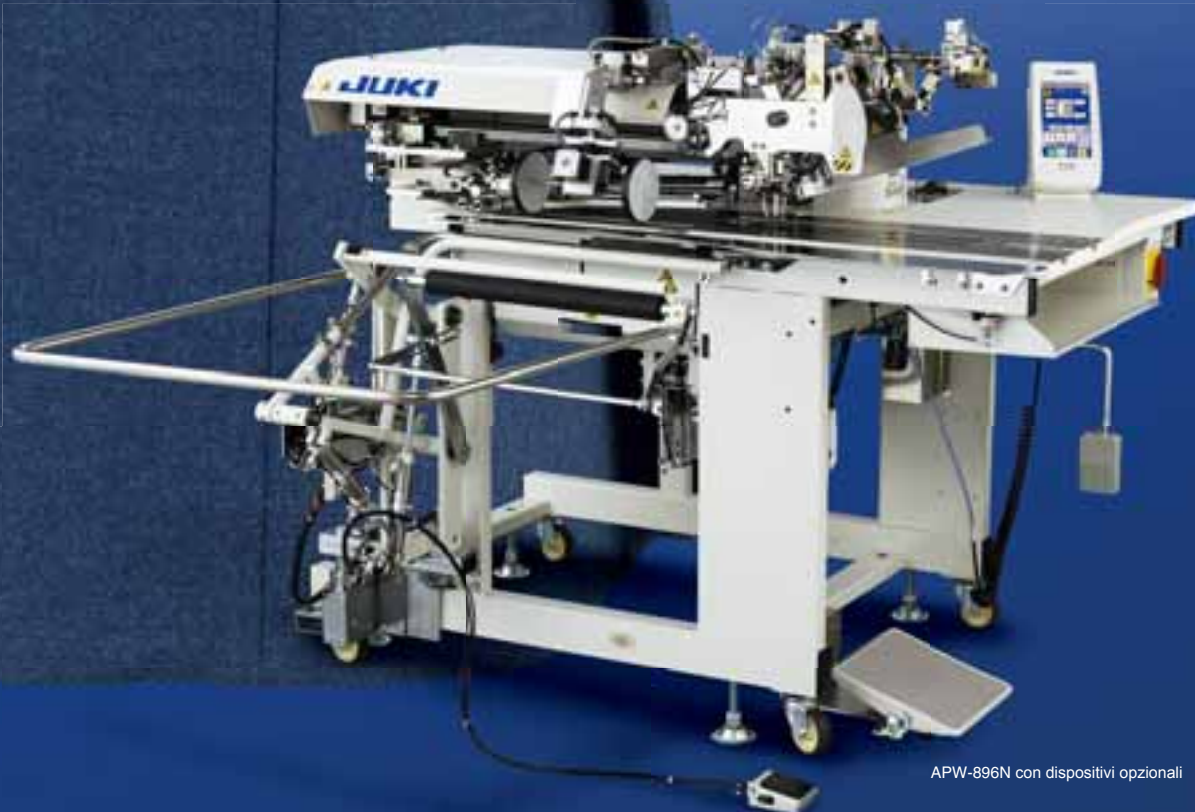
APW-896N con dispositivi opzionali

Macchine flessibili, adattabili alla applicazione delle varie tasche