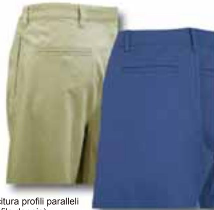
Cucitura profili paralleli (profilo doppio)