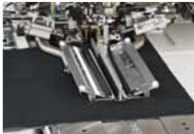
*La figura mostra la APW-896N.