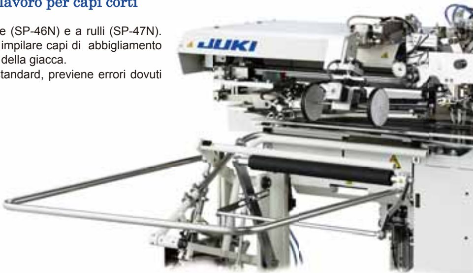
SP-46N: Impilatore a barre